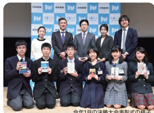
今年1月の決勝大会表彰式の様子

【日程】2018年1月28日(日) 【会場】早稲田大学 井深大記念ホール(東京都新宿区) ブロック大会、都府県大会の優勝者を招待します。